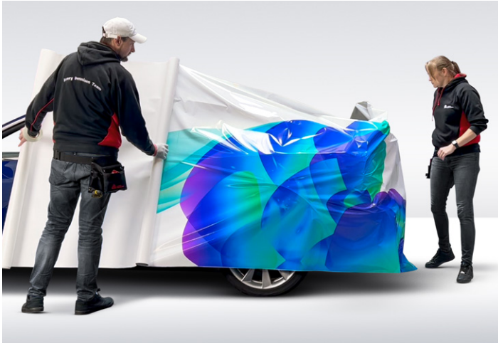
Die Easy Apply™ Technologie und eine geringe Anfangshaftung ermöglicht das einfache Repositionieren der Folie.