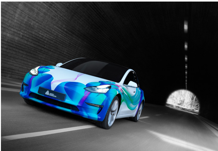
Ausgezeichnete Haltbarkeit im Außenbereich – unbedruckt bis zu 10 Jahre und bedruckt 6 Jahre*.