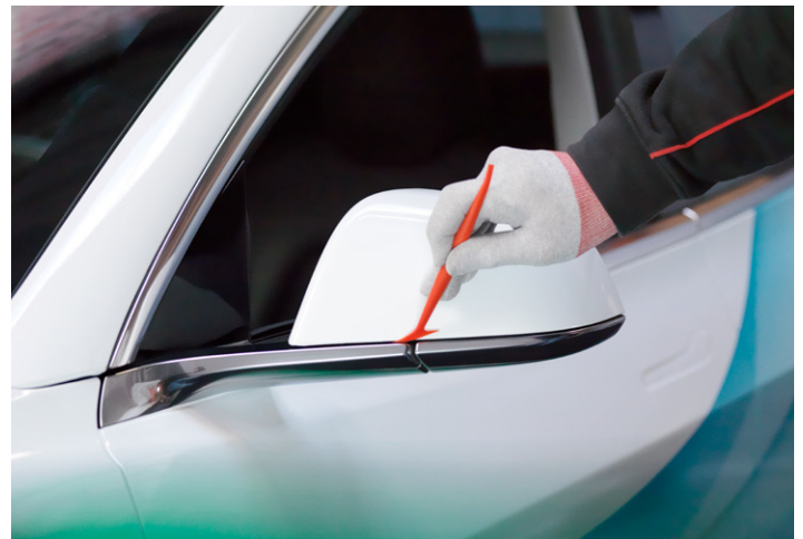
Hervorragende Verformbarkeit für schwierige Fahrzeugfolierungen – auch für größere Flotten.

Wenden Sie sich für weitere Informationen an Ihren Verkaufsvertreter oder besuchen Sie die Website von Avery Dennison unter: graphics.averydennison.de/sp1504