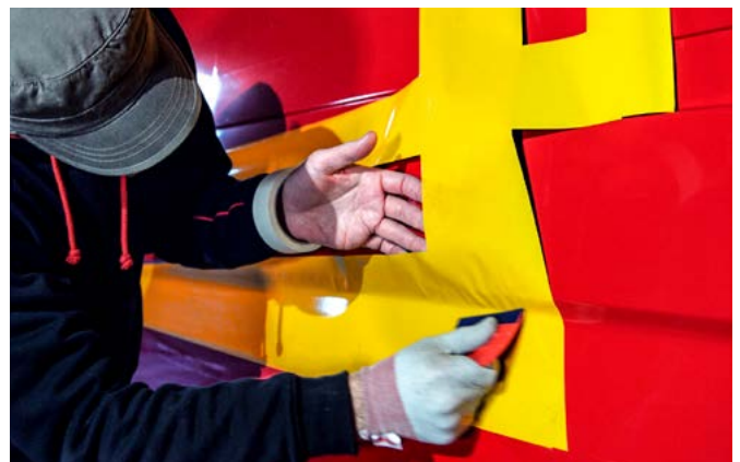
Avery Dennison V-4000 E mit Easy Apply RS für eine schnelle und einfache Anwendung.