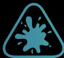
Beständig gegen Flecken