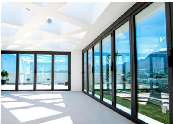
SS Natural 70 XTRM