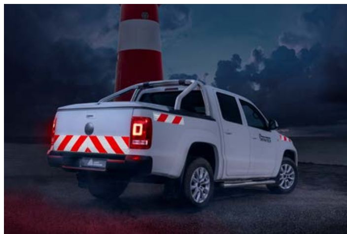
Avery Dennison Chevron White/Red se utilizar para marcar los vehículos de acuerdo con las normas DIN30710 y TPESC-B.