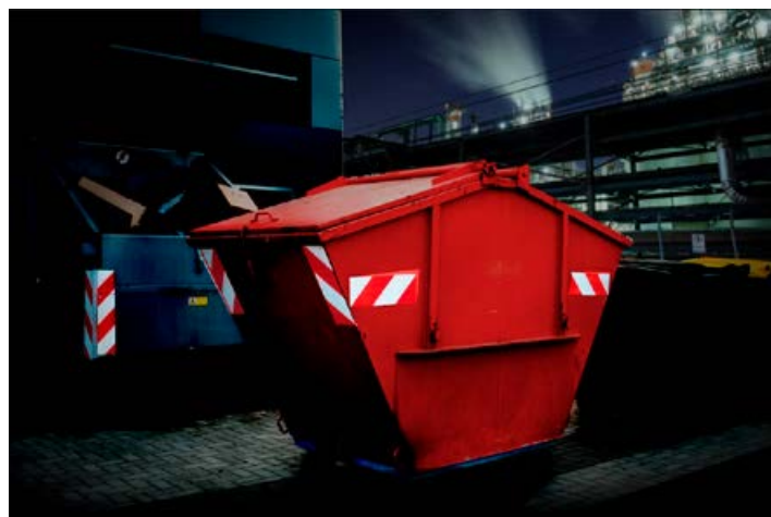
Avery Dennison Chevron White/Red se utiliza para marcar el riesgo en los envases.

* Tenga en cuenta que se requiere un permiso especial para usar el marcaje de peligro amarillo/rojo fluorescente en los vehículos de emergencia.