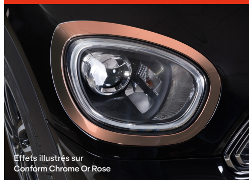
Effets illustrés sur Conform Chrome Or Rose

Faites briller votre design avec des accents Chrome effet miroir pour une finition haut de gamme.