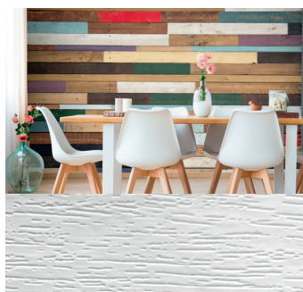
MPI™ 8726 Wall Film Wood