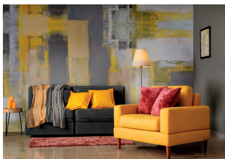
MPI™ 8626 Smooth Hi-Tack