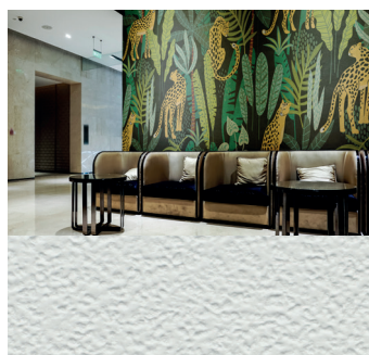
MPI™ 8726 Textured Stone