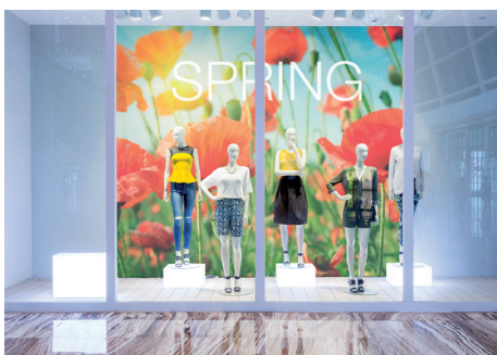
MPI™ 8621 Removable